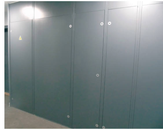
avec option : rosace