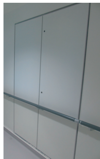
avec option : configuration hospitalière