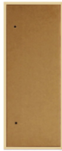
TECAPI 00 MD22 RP