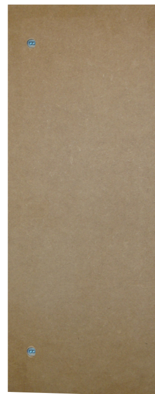
TECAPI 00 MD22 RT