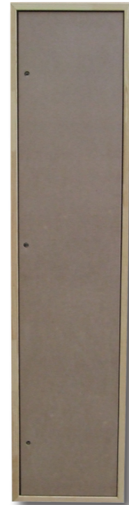
TECAVI 00 MD22