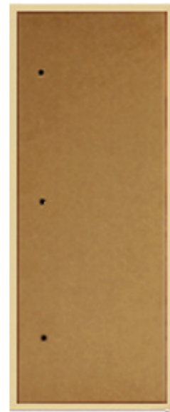
TECAPI 15 MD22 RP