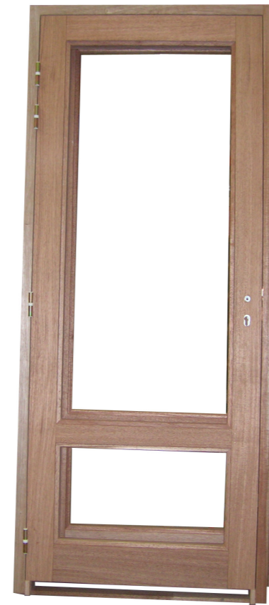
Bloc-porte vitré EI30